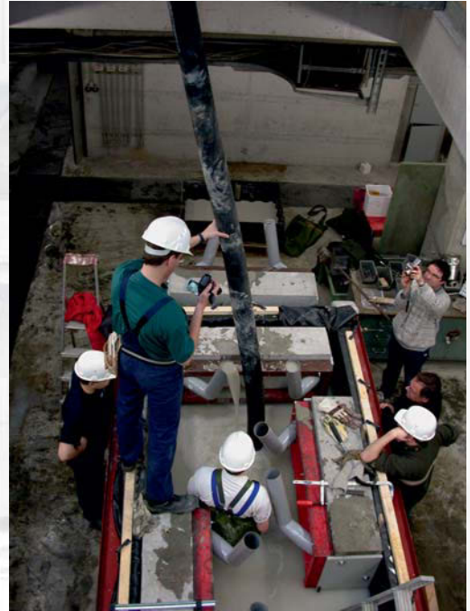
Pumpversuche an Unterwasser-Instandsetzungsbetonen

Eine der Kernkompetenzen der MPA Karlsruhe stellt die gezielte Entwicklung von Betonen bzw. mineralisch gebundenen Werkstoffen mit maßgeschneiderten Eigenschaften dar. Das umfassende betontechnologische Know-how in Verbindung mit einer optimalen technischen Ausstattung der MPA Karlsruhe ist dabei beispielsweise bei der Entwicklung von Sichtbetonen mit besonderen ästhetischen Eigenschaften bundesweit gefragt. Beispielsweise war die MPA Karlsruhe maßgeblich an der Entwicklung der Betone für das Kirchenzentrum Freiburg und das Landgericht Frankfurt/Oder beteiligt, um nur einige Beispiele zu nennen. Im Bereich der Ingenieurbetone dürfen wir auf unsere Arbeiten zur Instandsetzung von Bauteilen durch Betonage unter Wasser im russischen Wolgograd oder die Entwicklung von äußerst leichten und wärmedämmenden selbstverdichtenden Betonen verweisen.