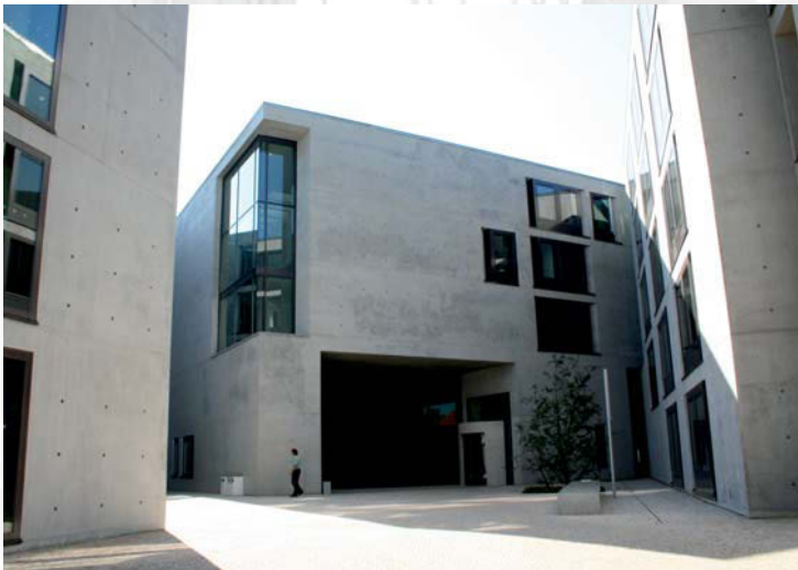
Land- und Amtsgericht Frankfurt/Oder

Darüber hinaus bieten wir technische Sonderentwicklungen an, die beispielsweise den Bauablauf vereinfachen bzw. beschleunigen oder aber die Lebensdauer und die Betriebssicherheit des Bauwerks erhöhen und somit die Betriebskosten minimieren. Dies geht mit der gezielten Entwicklung von Lebenszyklusmanagementkonzepten für das individuelle Bauwerk einher.